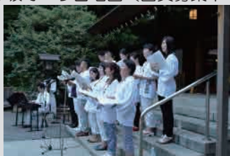
協力：赤坂氷川合唱団「弥栄」